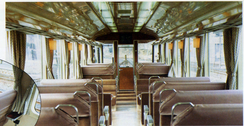
▲大型固定窓、明るい室内、左右の大きな展望、前方視界も広々と四季おりおりの景色をゆっくりとお楽しみいただけます。