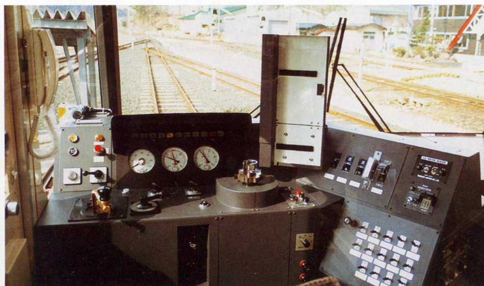
▲広い視界と安全性を重視した装備、コンパクトにまとめた計器台。